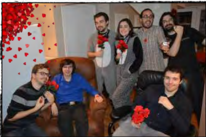
L'important c'est la rose...