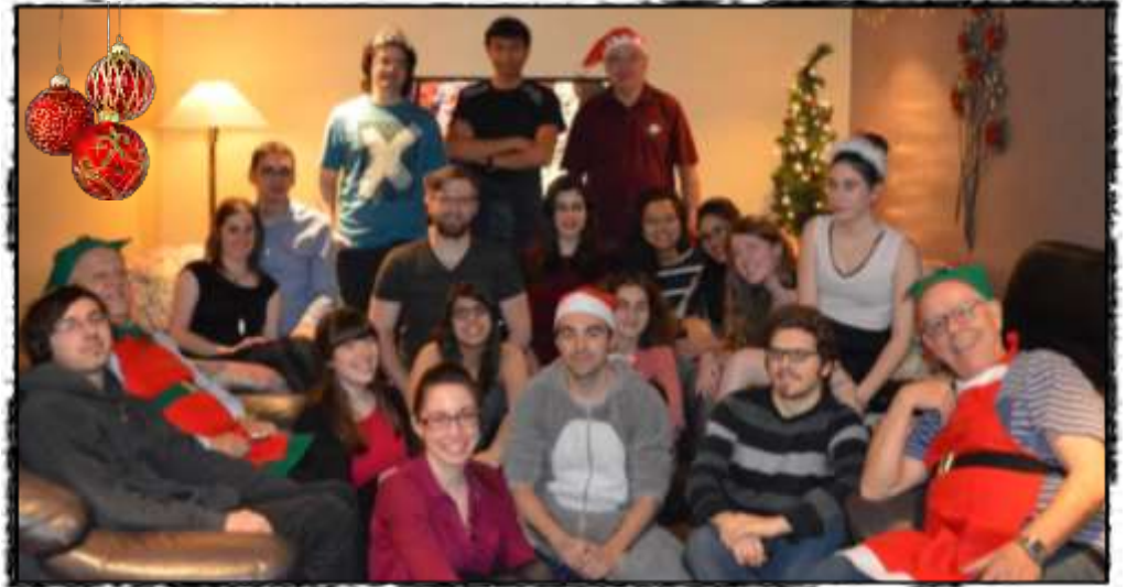
La fête de Noël 2017 a rassemblé de joyeux lutins pleins d'entrain

Une particularité caractérise le modèle de notre Maison d'accueil: chacun(e) peut inviter quand bon lui semble un ou deux amis aux repas. Mais c'est surtout en des moments forts de l'année que la maison se remplit à l'occasion des célébrations annuelles telles que le barbecue de la rentrée scolaire, l'Halloween, Noël, la Saint-Valentin et Pâques.