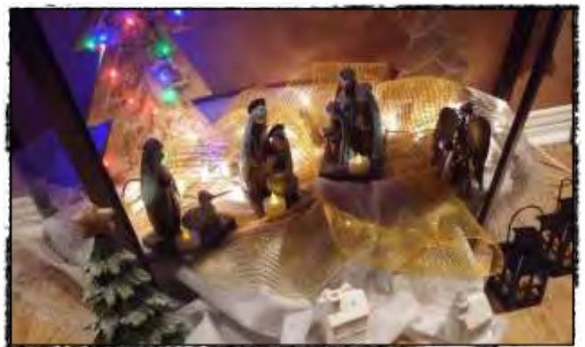
À l'ombre de la crèche, tout est prêt...