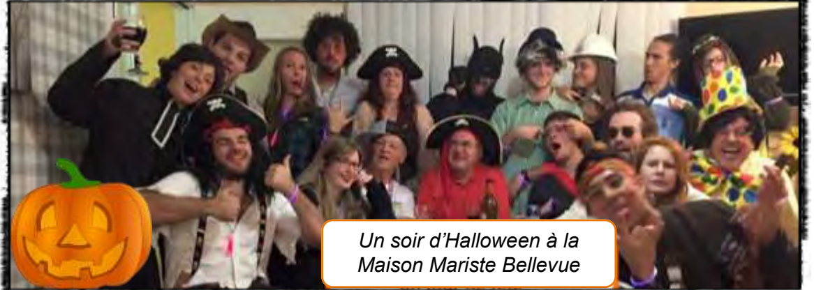
Un soir d'Halloween à la Maison Mariste Bellevue