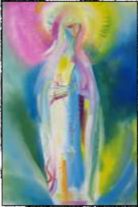
La Vierge de Bellevue