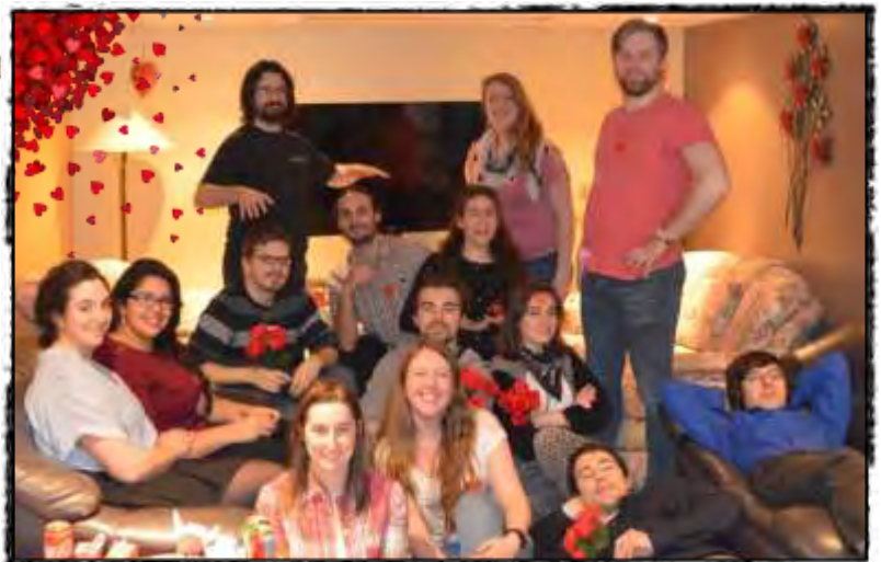
Les plus vaillants « veilleurs » ont pris la photo avant de se dire à la prochaine....