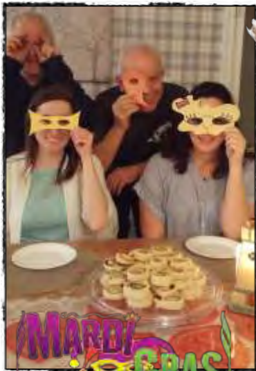
On fête le Mardi Gras... Sous l'éclairage du phare, cœurs réunis pour goûter les sucreries avant le mercredi des Cendres....