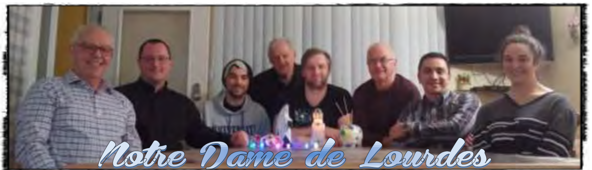
Notre Dame de Lourdes