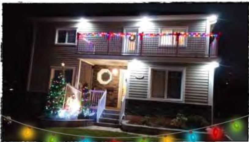
La Maison Mariste de Sherbrooke toute décorée pour Noël... avant les grosses bordées de neige !

PLACES DISPONIBLES - AUTOMNE 2018 Pour ceux et celles qui seraient intéressé(e)s à vivre cette expérience mariste à la session prochaine, il vous faut réserver votre place dès le printemps dès que vous êtes accepté(e) à l'Université de Sherbrooke (en avril ou mai).