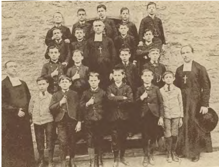
Classe de première année (1889-1889)