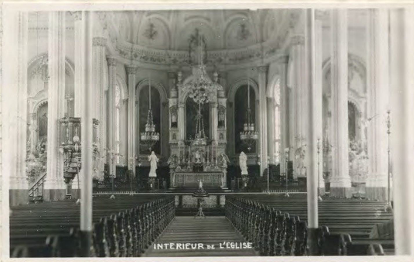
Intérieur de l'église Saint-Joseph.

L'engagement des Frères est fait pour un an.